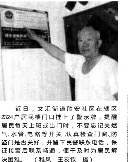
近日，文汇街道泰安社区在辖区2324户居民楼门口挂上了警示牌，提醒居民每天上班或出门时，不要忘记关燃气、水管、电路等开关，认真检查门窗、防盗门是否关好，并留下民警联系电话，保证报警后联系畅通，便于及时为居民解决困难。

本报讯 进入6月份以来，随着气温的升高，夏季冷饮市场开始火爆，一大批冷饮营销网点和生产厂家开始营业和上马。为保障广大市民特殊时期的身体健康和食品卫生，东营区质量技术监督部门对辖区上百个夏季冷饮营销网点和生产厂家进行了检查整顿。 在清理整顿中，东营区质量技术监督部门组织执法人员对城区及乡镇的上百个夏季冷饮营销网点和生产厂家进行了现场拉网式的检查。执法人员经过随机抽检发现，今年的冷饮的合格率比去年有所提高，合格率达到了九成以上。另外，也有一些不法分子经营一些劣质的冷饮坑害消费者，在检查中，东营区共查获假冒伪劣牛奶60箱，劣质饮料100箱，假劣冰糕50多箱，并当场取缔无照经营的非法营销户16家，为广大市民营造了一个安全放心的消费环境。 (王克勇)